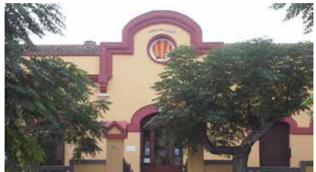
Ateneu Cultural i Recreatiu de Santa Margarida de Montbui