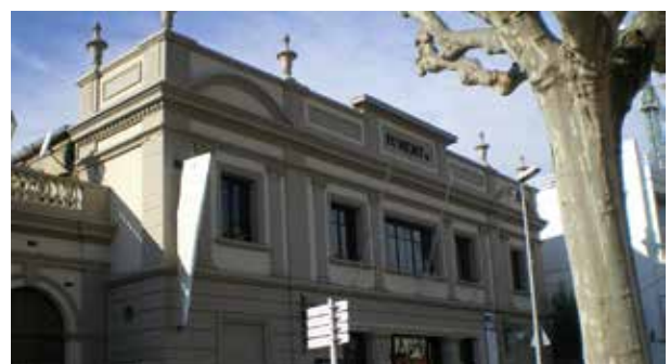
Foment Cultural i Artístic de Molins de Rei