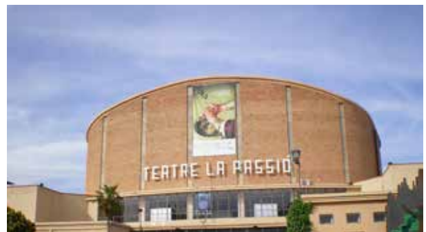
La Passió d'Esparreguera