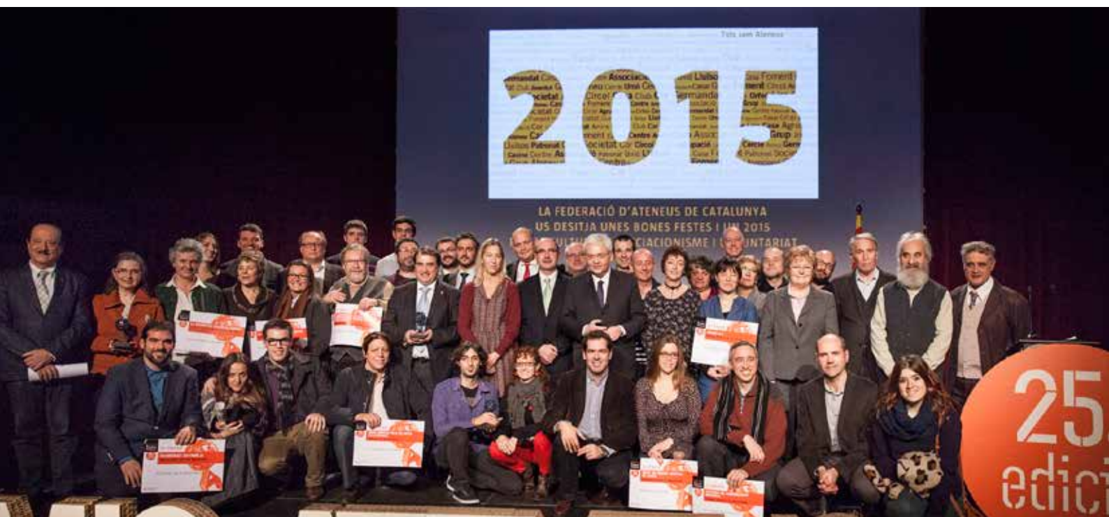
Premiats 2015 amb les autoritats assistents.