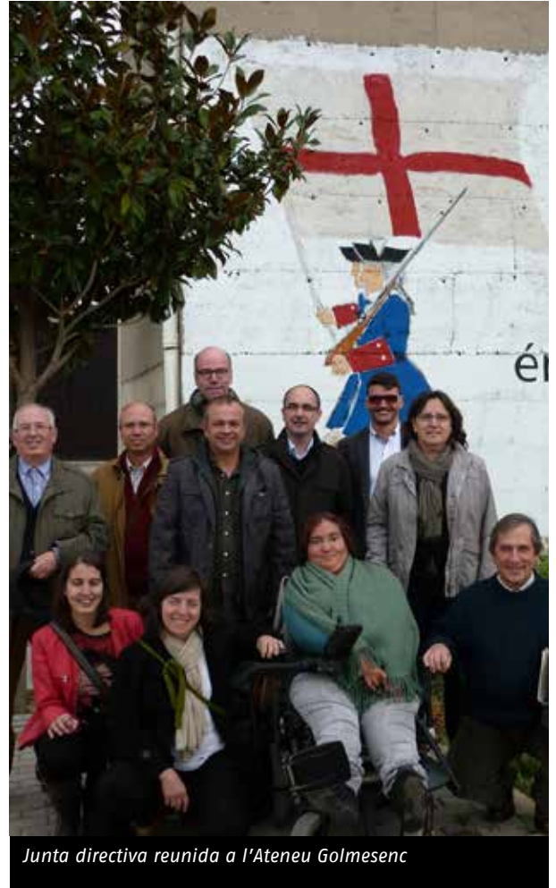
Junta directiva reunida a l'Ateneu Golmesenc

L a Federació ha organitzat periòdicament trobades al territori amb l'objectiu de presentar els nous projectes i serveis, i apropar-se a les entitats per conèixer de primera mà la seva realitat. Des del mes de setembre se n'han celebrat quatre: a Reus, a la Germandat de Sant Isidre i Santa Llúcia; a Golmés, a l'Ateneu Golmesenc; a Figueres, a la Catequística; i a Lleida, a l'Orfeó Lleidatà.