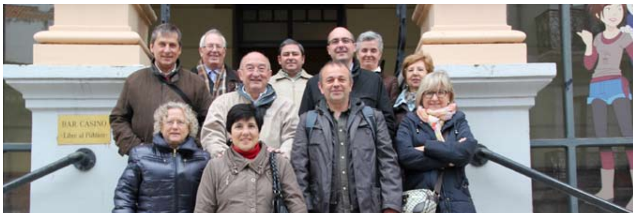
Els representants de la FAC i els ateneus federats