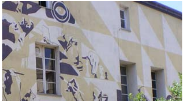
Amics de les Arts i Joventuts Musicals de Terrassa