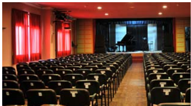
L'Avenç Centre Cultural d'Esplugues de Llobregat