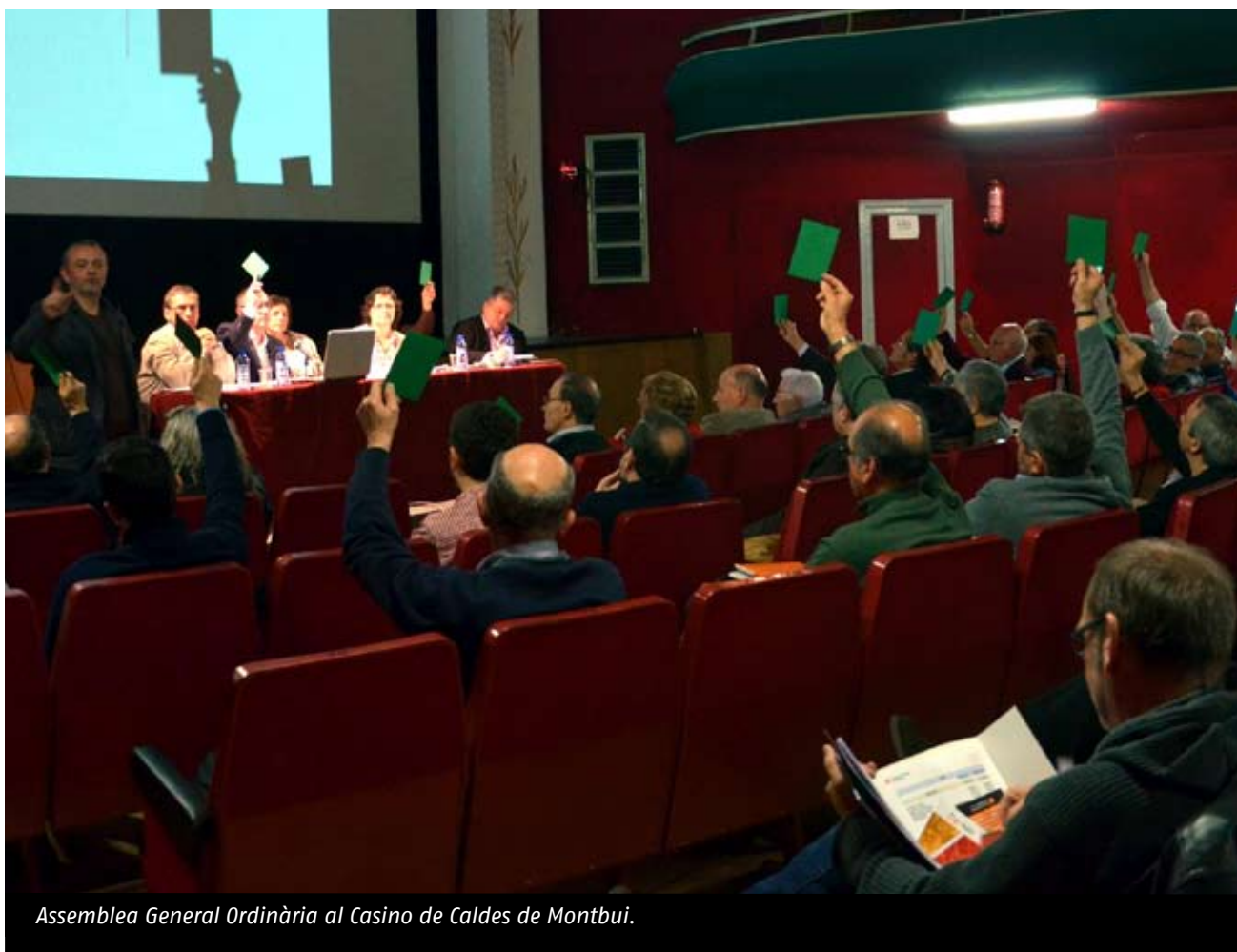
Assemblea General Ordinària al Casino de Caldes de Montbui.

Podeu consultar la Memòria 2013 aprovada durant l'Assemblea, l'estat de comptes i descarregar-vos tant el Pla Estratègic 2014-2020 com la Guia del Bon Govern al web de la Federació.