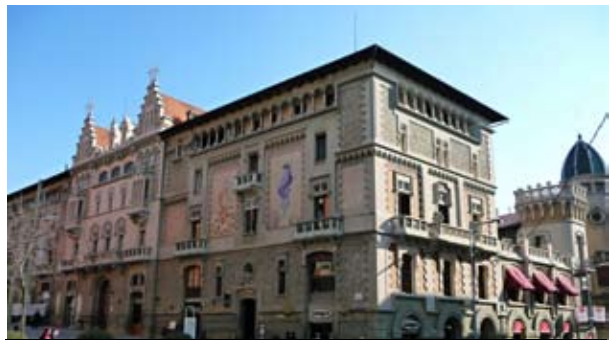
Casino de Vic