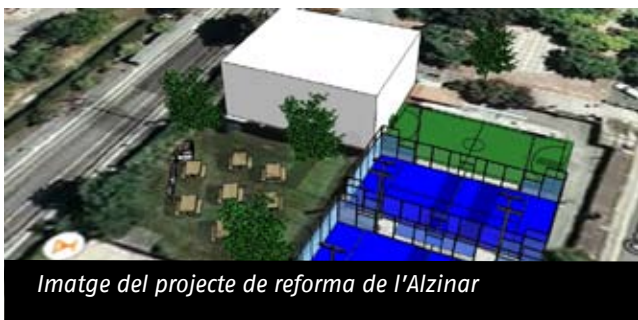
Imatge del projecte de reforma de l'Alzinar

L'Alzinar engega un canvi d'època important, un moment clau en què han decidit actuar i invertir per garantir la supervivència de l'entitat.