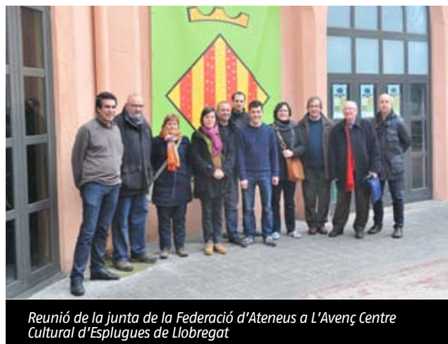
Reunió de la junta de la Federació d'Ateneus a L'Avenç Centre Cultural d'Esplugues de Llobregat