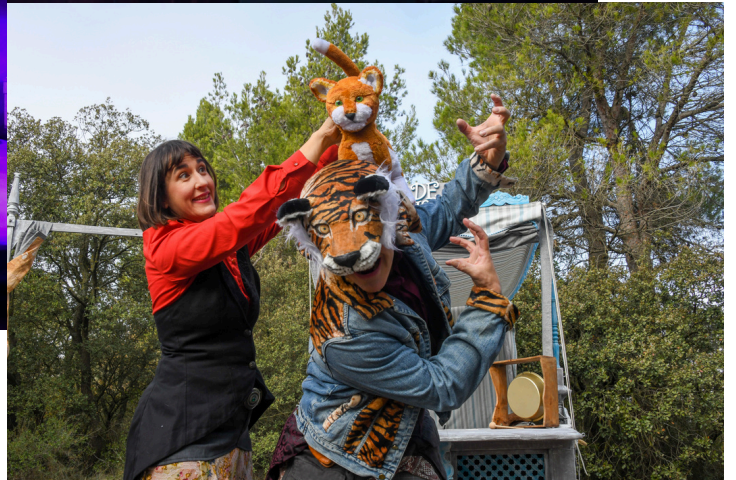
Imatges d'arxiu d'altres espectacles de la companyia

Un espectacle de teatre familiar de titelles i màscares que ens convida a fer un viatge ple d'imaginació a través de quatre llegendes: tres d'arrel catalana i una quarta creada en directe amb la participació del públic . Són històries que parlen de somnis, desitjos, natura, igualtat i creativitat col·lectiva, convidant petits i grans a deixar-se portar per la fantasia.