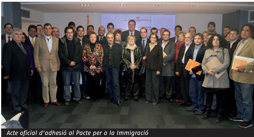
Acte oficial d'adhesió al Pacte per a la Immigració

El Pacte inclou 65 polítiques a reforçar i 50 noves mesures a assolir abans del 2020, algunes de les quals ja s'han assolit i altres s'estan desplegant en l'actualitat.