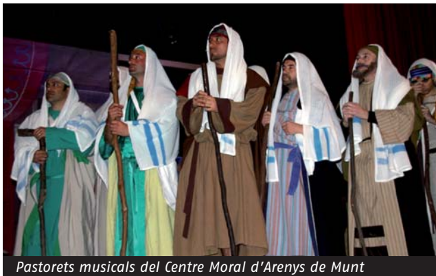
Pastorets musicals del Centre Moral d'Arenys de Munt

E n els darrers tres mesos, des de la Federació s'ha donat continuïtat al compromís de visitar les nostres entitats federades. Així doncs, durant el més de novembre s'han anat a veure, a Lleida, l' Ateneu Popular de Ponent i el Sícoris . També s'ha visitat La Lira Vendrellenca , al Vendrell; el Centre Cultural Ribetà els Xulius , a Sant Pere de Ribes; la Societat Cultural El Retiro , a Sitges; l' Avenç Centre Cultural , a Esplugues del Llobregat; el Centre Moral i Cultural de Poblenou , a Barcelona, i l' Aliança de Cubelles.