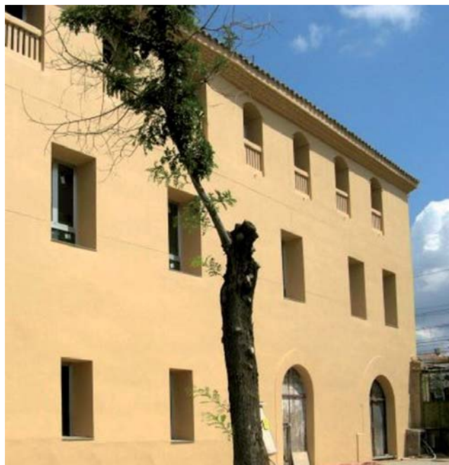
La Societat Coral La Unió de Cornellà de Llobregat

L a Societat Coral la Unió de Cornellà de Llobregat s'ha convertit en la darrera incorporació a la FAC. L'entitat té una història apassionant i fortament lligada a la localitat des de les seves primeres passes (l'any 1853). Ara fa un pas més cap al futur unint-se al projecte global de la FAC. Podeu descobrir-ne més a través de la seva pàgina web: http://www.launiodecornella.com/