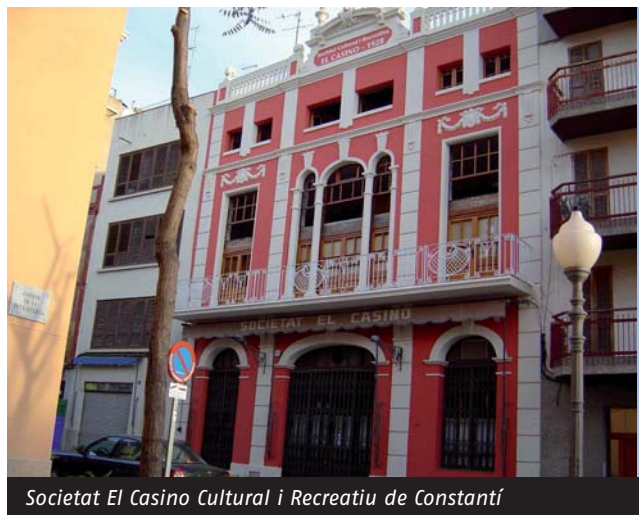
Societat El Casino Cultural i Recreatiu de Constantí

També volem donar la benvinguda a la Societat El Casino Cultural i Recreatiu de Constantí. Fundada l'any 1928 a l'edifici emblemàtic de l'arquitecte Pere Caselles, el Casino és un centre de referència a la vida social i cultural de Constantí. ( http://webfacil.tinet.org/casino )