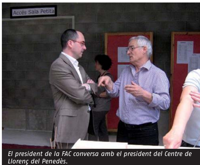
El president de la FAC conversa amb el president del Centre de Llorenç del Penedès.

Per la seva banda, el gerent de la Federació ha visitat La Massa, Centre de Cultura Vilarassenc (Vilassar de Dalt), la Societat La Concòrdia de Cabriels, l'Ateneu Barcelonès, el Centre Cultural d'Arenys de Munt, l'Ateneu Arenyenc (Arenys de Mar), la Societat Cultural Sant Jaume (Premià de dalt) i la Societat Recreativa i Cultural l'Alzinar de Masquefa.