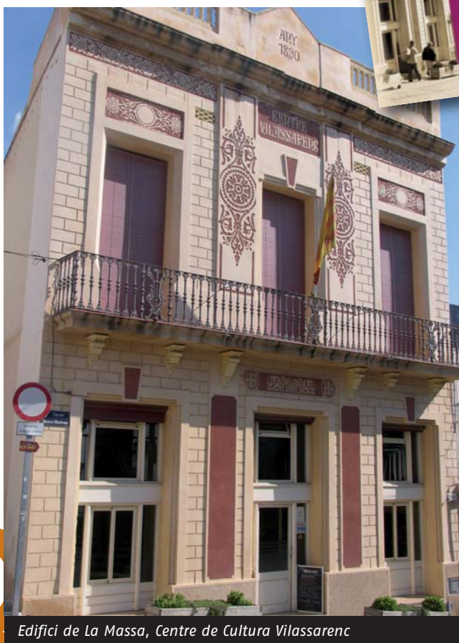
Edifici de La Massa, Centre de Cultura Vilassarenc

La Massa Centre de Cultura Vilassarenc c/ Mestre Viladrosa, 56 08339 Vilassar de Dalt www.lamassaccv.org (en construcció)