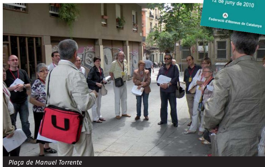
Plaça de Manuel Torrente