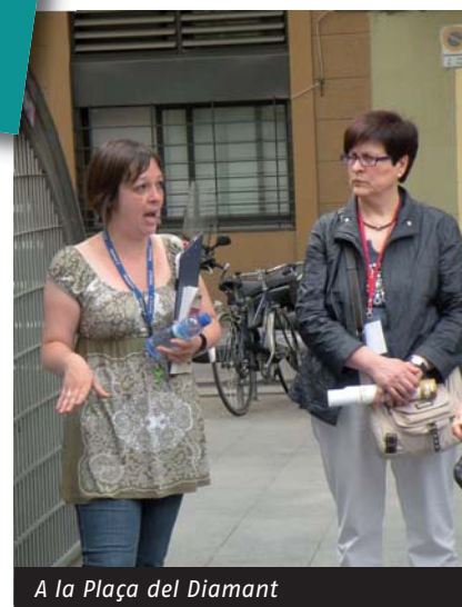
A la Plaça del Diamant