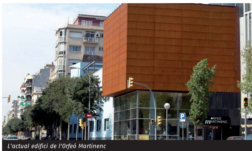
L'actual edifici de l'Orfeó Martinenc

Orfeó Martinenc Av Meridiana 97 08026 Barcelona Tel.93 245 39 90 orfeomartinenc@gmail.com