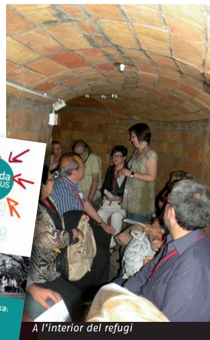
A l'interior del refugi