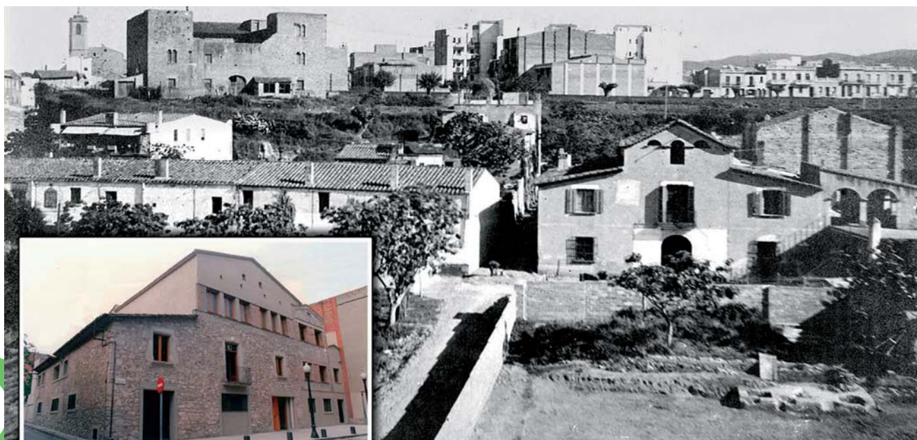
El Patronat Cultural i Recreatiu

Patronat Cultural i Recreatiu C. Mossèn Cinto Verdager, 52 08940 Cornellà de Llobregat Tel. 933770229 patronatcr@telefonica.net