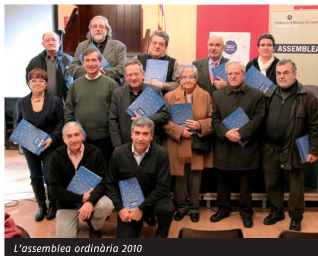
L'assemblea ordinària 2010

Trobareu més informació a www.ateneus.cat/assemblea2010