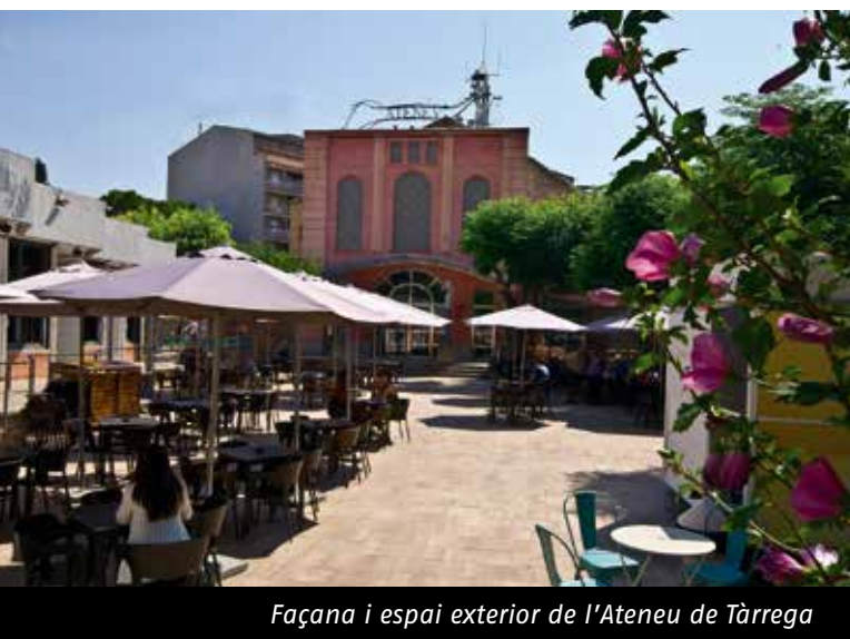
Façana i espai exterior de l'Ateneu de Tàrraga

Tot i això, són més les entitats que es troben en procés de realització d'estudis previs o amb estudis fets per iniciar les rehabilitacions dels seus equipaments, que les que no han iniciat aquest procés, i encara que l'estudi destaca la gran complexitat que hi ha per resoldre el compliment de les normatives , que impliquen grans reformes als edificis, de les entitats visitades, 70 tenen fet algun projecte de reforma .