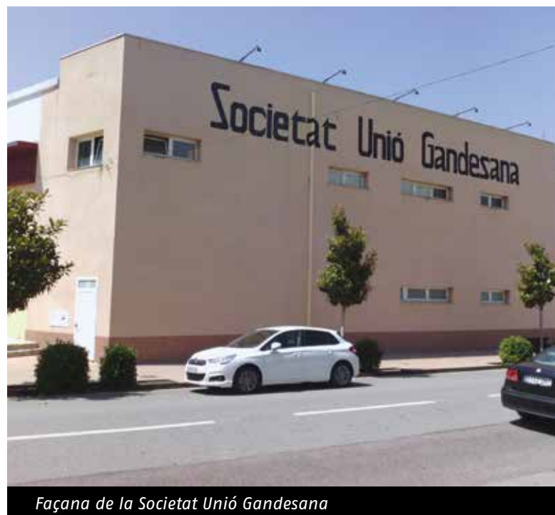
Façana de la Societat Unió Gandesana