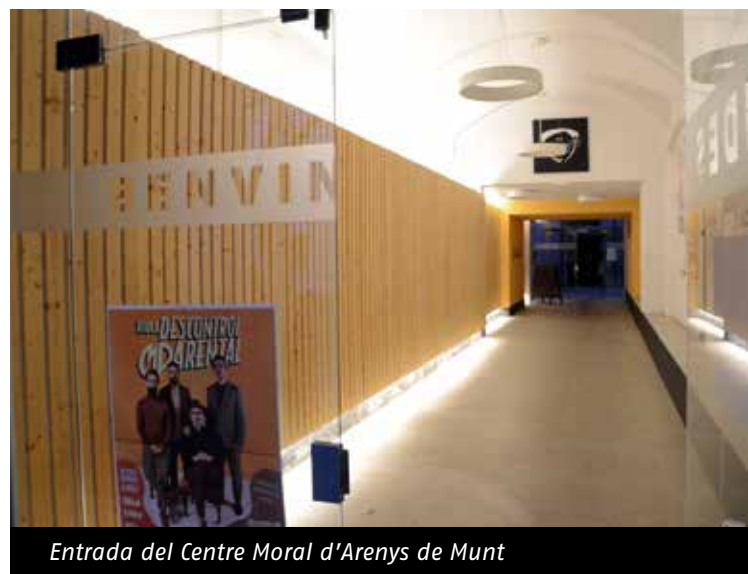
Entrada del Centre Moral d'Arenys de Munt