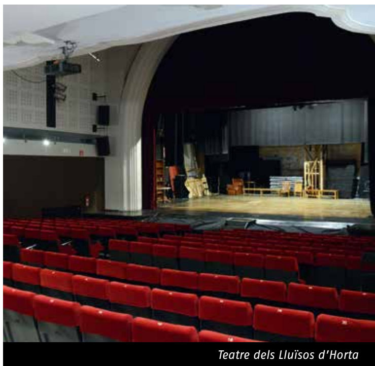
Teatre dels Lluïsos d'Horta

Aquesta valoració ajuda a clarificar el punt on es troben les entitats a tot Catalunya i permet identificar-ne les carències més urgents. Tanmateix, tots aquests processos d'adequació no poden ser resolts únicament per les entitats , sobretot pels forts obstacles econòmics que suposen aquestes obres, i és per això que la FAC ja ha iniciat els tràmits per donar a conèixer a l'Administració l'estat actual d'aquestes entitats , buscant l'ajuda i el suport necessaris perquè els ateneus puguin continuar treballant per la cultura i pel país.