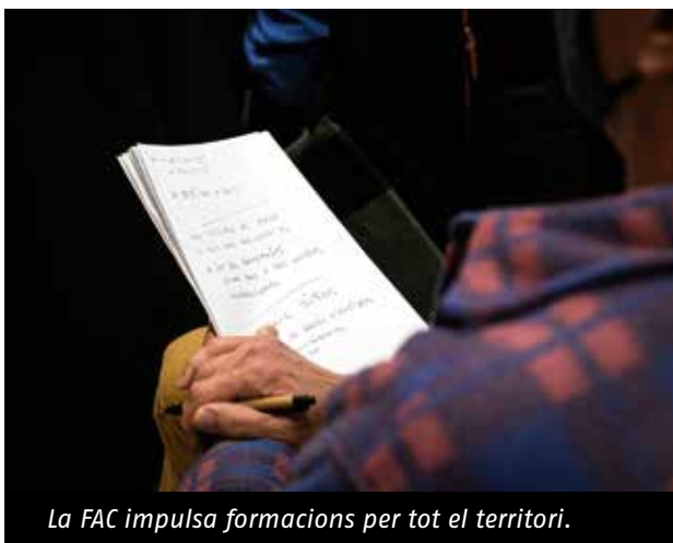
La FAC impulsa formacions per tot el territori.