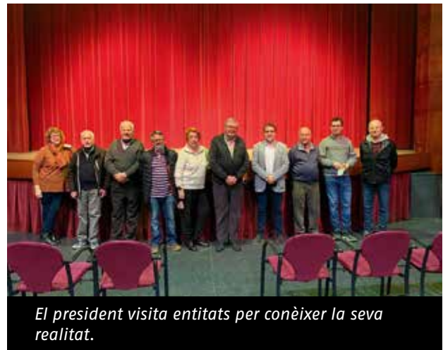
El president visita entitats per conèixer la seva realitat.

A més, volem seguir actuant per visualitzar tota aquesta feina tant a nivell intern com de cara a l'opinió pública . Per aquest motiu s'està fent un esforç en l' àmbit de Comunicació mitjançant diverses accions, com l'increment de la presència mediàtica, amb un contacte més constant amb els mitjans, o la creació del Consell editorial per a l'edició de la revista ATENEUS , que a partir d'aquest any publicarà tres números anuals en lloc de dos.