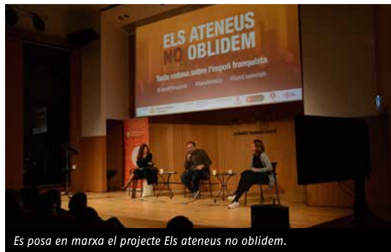
Es posa en marxa el projecte Els ateneus no oblidem.