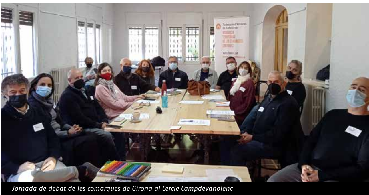
Jornada de debat de les comarques de Girona al Cercle Campdevanolenç