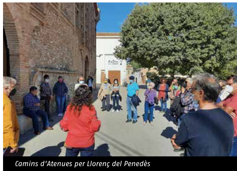
Camins d'Ateneus per Llorenç del Penedès

Escriu a ateneus@ateneus.cat i t'informarem de tot!