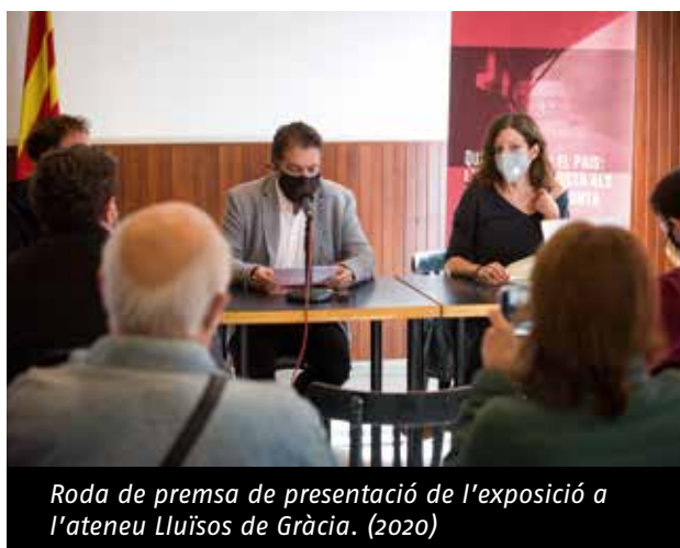
Roda de premsa de presentació de l'exposició a l'ateneu Lluís de Gràcia. (2020)