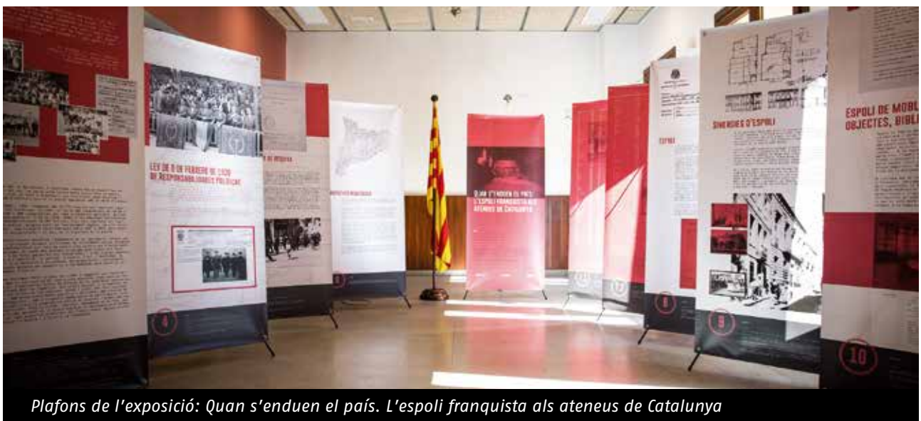
Plafons de l'exposició: Quan s'enduen el país. L'espoli franquista als ateneus de Catalunya

L'origen d'aquest projecte es troba en el manifest signat l'any 2014 a l' Ateneu Barcelonès per entitats culturals, cíviques i socials afectades pel règim franquista. En el manifest es defensava que, abans de l'espoli franquista, el moviment associatiu català va ser garant de l'ensenyament popular, del fet de protecció social i laboral, i del fet humanístic i lliurepensador. Aquell moviment va articular, a través dels ateneus i altres entitats, un conjunt d'activitat política i social, de promoció de la cultura, la salut i l'esport, que el règim dictatorial va aniquilar, apoderant-se d'un patrimoni de gran valor cultural i econòmic. Segons Moran: « La requisita patrimonial fou un mecanisme repressiu que el franquisme utilitzà de manera