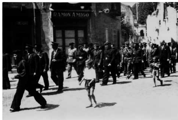
Desfilada a Sant Feliu amb motiu de la Fiesta de la Liberación (1939-1942).

Per tot això, volem afrontar l'any 2022 com una etapa de difusió i reivindicació orientada a teixir complicitats i a aconseguir els suports necessaris per fer justícia amb els ateneus espoliats. Juntament amb el nou itinerari de l'exposició, es començarà també un cicle de xerrades i taules rodones amb historiadors, polítics i experts per aconseguir mantenir viu el focus del debat. En paral·lel, seguirem investigant per conèixer a fons la realitat de l'espoli als ateneus.