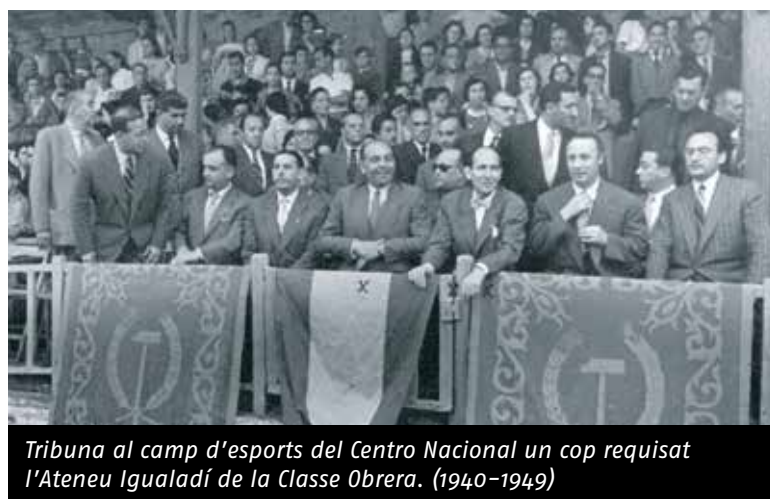
Tribuna al camp d'esports del Centro Nacional un cop requisat l'Ateneu Igualadí de la Classe Obrera. (1940-1949)