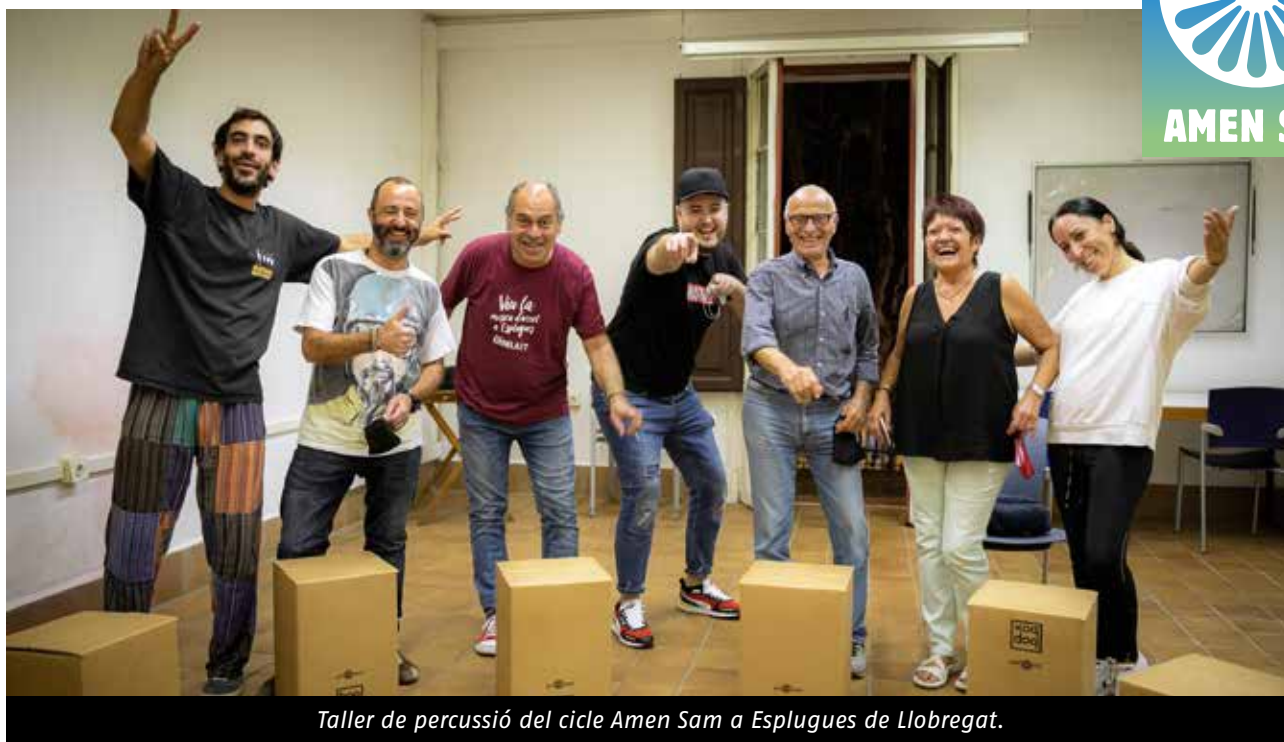
Taller de percussió del cicle Amen Sam a Esplugues de Llobregat.

Per a la FAC, la integració de social de totes les cultures que han construït la identitat social catalana és una prioritat, per aquest motiu ha organitzat el cicle AMEN SAM amb la col·laboració de la Federació d'Associacions Gitanes de Catalunya (FAGiC) , el Departament de Drets Socials de la Generalitat de Catalunya i la Fundació «la Caixa» .