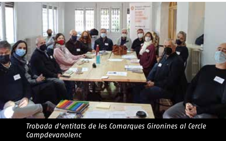
Trobada d'entitats de les Comarques Gironines al Cercle Campdevanolenc