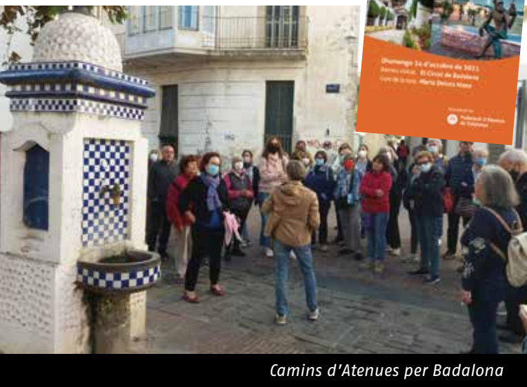
Camins d'Ateneus per Badalona