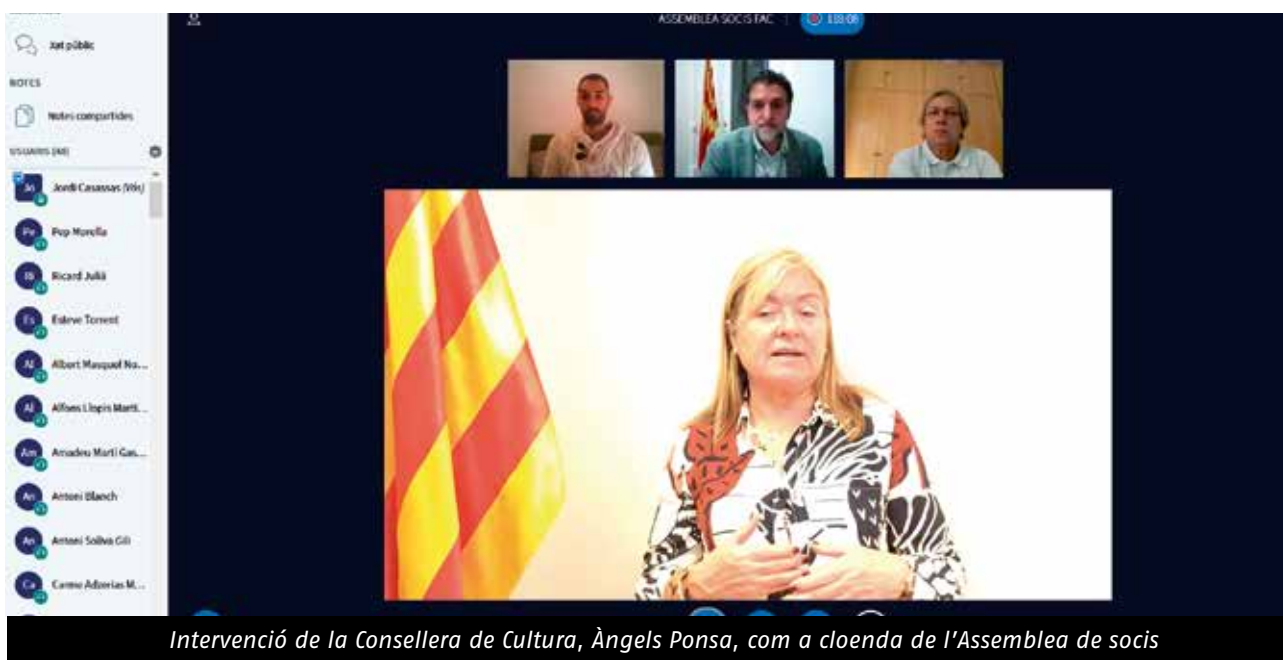
Intervenció de la Consellera de Cultura, Àngels Ponsa, com a cloenda de l'Assemblea de socis

Entre les mesures que proposa el text, es fa incís en la possibilitat d'ajornar, reduir o bonificar els impostos que graven sobre les entitats culturals. La declaració aprovada també demana que se les tingui en compte a l'hora de prendre les decisions, per poder planificar amb temps les respostes que pertocin a l'impacte de les mesures que decreti el Govern.