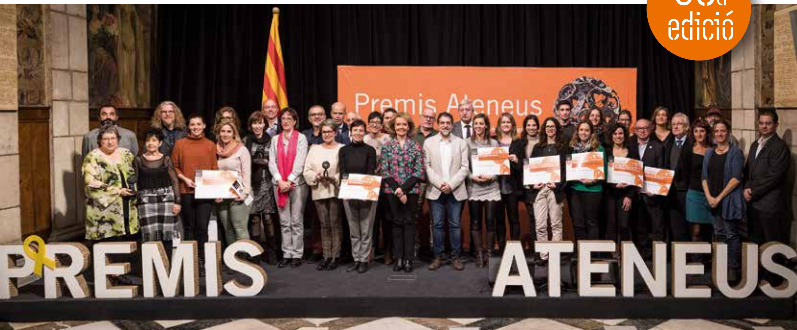
Els premiats a la 30a edició dels Premis Ateneus