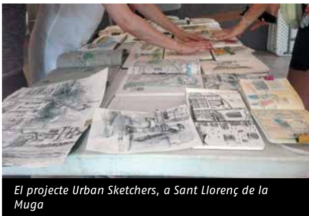
El projecte Urban Sketchers, a Sant Llorenç de la Muga

Des de la provisional junta rectora de la delegació territorial de Girona es fa una crida a totes les entitats a presentar les seves candidatures, per tal crear una junta diversa que representi la pluralitat d'entitats que la formen. Ajudem-nos a créixer entre tots i totes!