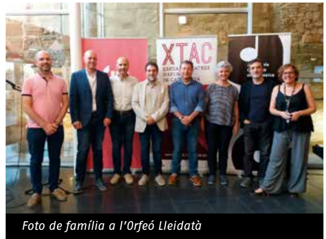
Foto de família a l'Orfeó Lleidatà