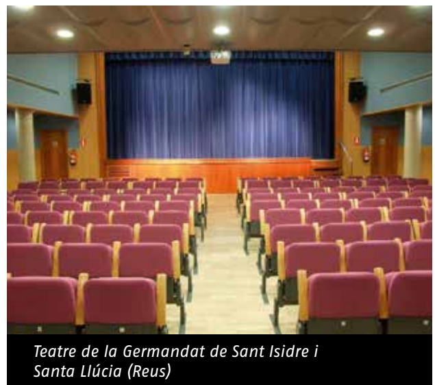
Teatre de la Germandat de Sant Isidre i Santa Llúcia (Reus)

Després de la primera trobada del febrer, el passat 30 de març es celebrà al Centre de Lectura de Reus la segona part del debat sobre Ateneus i Actualitat. Aquesta vegada, els punts a comentar van girar al voltant de la intergeneracionalitat en els ateneus i la perspectiva de gènere en el pensar de les entitats, unes qüestions molt importants i necessàries en la situació actual de la societat. A més, també es van extreure conclusions sobre tots els punts amb una sèrie de propostes concretes de com poden actuar els ateneus per resoldre les qüestions que es van debatre. Finalment, destacar que l'assistència a aquesta segona part dels debats va ser molt alta per part dels ateneus que conformen la Delegació de la FAC al territori, i totes les intervencions van servir per poder encarar millor les conclusions del Congrés que es celebraren el 4 de maig a Premià de Dalt.