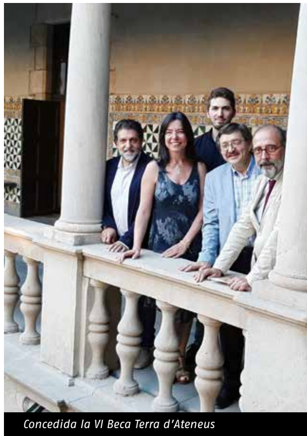
Concedida la VI Beca Terra d'Ateneus

El treball permetrà dotar a la ciutadania i al món acadèmic d'un nou enfocament sobre els ateneus populars i el seu transcendental impacte a escala municipal en el desenvolupament de la cultura catalanista del Principat, a més de ser un dels principals impulsors i alhora resultat de l'esperit associacionista de la nostra societat. El jurat va valorar molt positivament el fet que es tracti de l'estudi d'un àmbit territorial on s'han fet pocs treballs similars en l'actualitat i el que interrelacioni dues realitats comarcals diferents però properes.