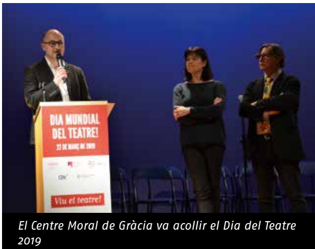
El Centre Moral de Gràcia va acollir el Dia del Teatre 2019