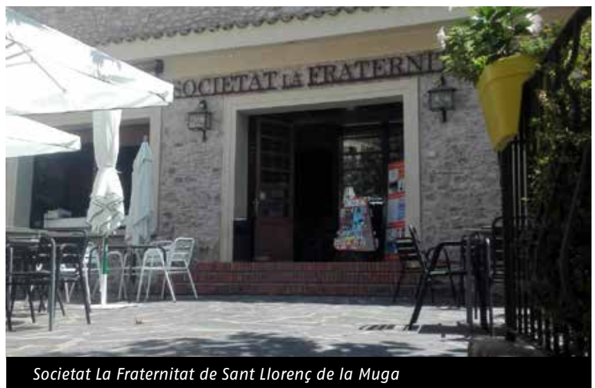
Societat La Fraternitat de Sant Llorenç de la Muga