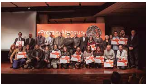
Entitats reconegudes als Premis Ateneus 2017. La Pedrera. Barcelona.