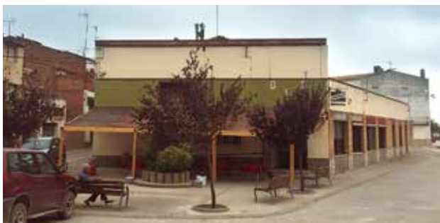
Unió Recreativa Maialenca (Maials, Segrià)