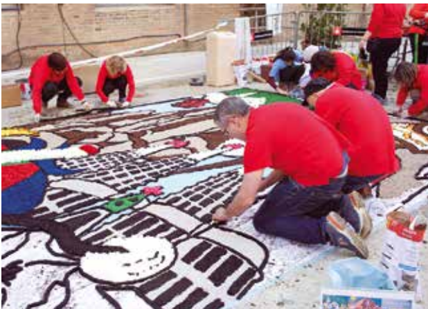
La Mostra Som Cultura Popular se celebrarà del 28 al 28 de gener a la Fabra i Coats, Barcelona.

Per segona ocasió, l'Ajuntament de Barcelona, junt a la Generalitat de Catalunya, impulsa la mostra Som Cultura Popular al recinte de Fabra i Coats (Sant Andreu, Barcelona). L'edició del 2018 es realitzarà del 25 al 28 de gener i la Federació d'Ateneus, novament hi participarà amb la seva presència en un estand informatiu; la conferència "Noves eines per a la gestió d'assegurances a les entitats de cultura popular" (26 de gener, 17h a l'escenari de presentacions); la presentació del Mosaic Ciutadà (27 de gener, 10:30h a la Fàbrica de creació) i l'exposició "L'Ateneu és casa teva: literatura" (durant tota la mostra al Museu Nòmada).