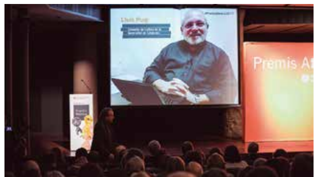
Projecció del missatge del conseller de Cultura, Lluís Puig.