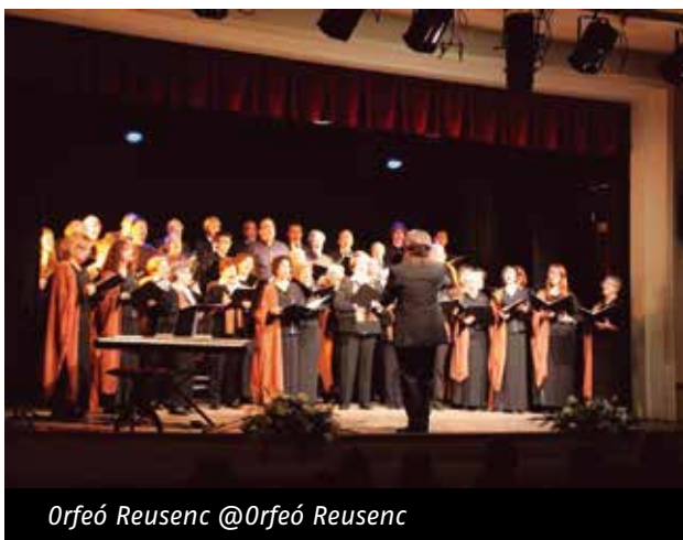
Orfeó Reusenc @Orfeó Reusenc

L' Orfeó Reusenc celebra 100 anys d'història aquest 2018 i ha presentat una candidatura a la Creu de Sant Jordi. És una entitat sense ànim de lucre que es dedica a fomentar la llengua i la cultura catalanes. Aquesta tasca la fa des de la vessant del cant coral, el teatre i la dansa, i des d'altres relacionades amb la cultura popular i tradicional com el ball de bastons. Per aconseguir el reconeixement l'entitat necessita el suport del màxim nombre possible d'entitats i de persones enviant un full d'adhesió (el trobareu al web de la FAC) al correu: orfeoreusenc@orfeoreusenc.cat