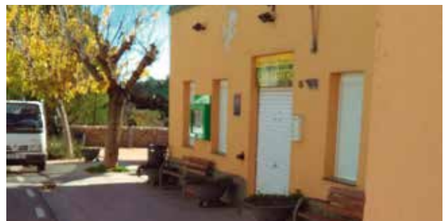
Centre Cultural Recreatiu Can Cartró (Subirats, Alt Penedès)