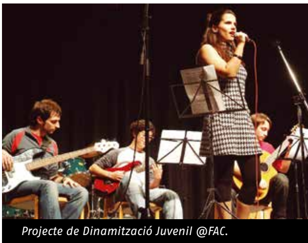
Projecte de Dinamització Juvenil @FAC.

El Projecte de Dinamització Juvenil impulsat per la Federació d'Ateneus pretén millorar, fomentar i consolidar la participació i la implicació de joves en les activitats que es duen a terme a les entitats federades d'arreu del territori, amb el suport d'una persona tècnica especialitzada en dinamització juvenil. El mes de setembre del 2017 es va iniciar una prova pilot d'un any escolar -fins al juny- a tres entitats: el Centre L'Avenir Fanalenc (Platja d'Aro), la Societat Unió Gandesana (Gandesa) i el Casino del Centre de L'Hospitalet de Llobregat. El projecte es desenvoluparà en tres fases: la primera (setembre-desembre 2017), d'implementació, diagnòsi i elaboració del pla d'acció; la segona (gener-abril 2018), d'acció amb un grup de joves i, per últim, la tercera (maig-juny 2018), de consolidació i avaluació dels objectius.