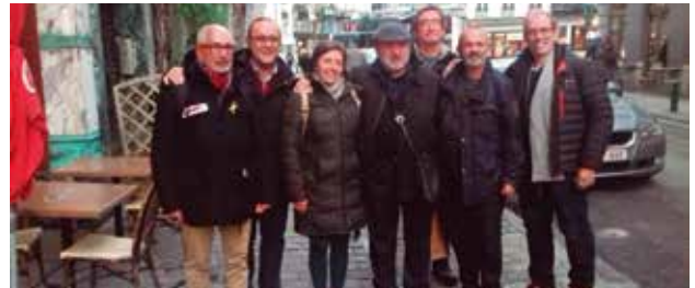
Delegació d'entitats federades a Brussel·les, 24 de novembre de 2017.