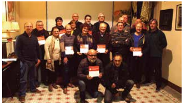
Lliurament de plaques a les entitats del Maresme i els Vallesos, 17 novembre 2017 @FAC.

P er tal de visibilitzar la tasca que desenvolupen les entitats federades al territori, la Federació d'Ateneus de Catalunya lliura plaques identificatives a les entitats adherides per a que les puguin col·locar a les seves seus. Abans de finalitzar el 2017 s'han fet actes de lliurament a les entitats de les Terres de Ponent; la ciutat de Barcelona; les comarques gironines i tarragonines; l'Alt Penedès, Garraf i Anoia; el Maresme i els Vallesos.