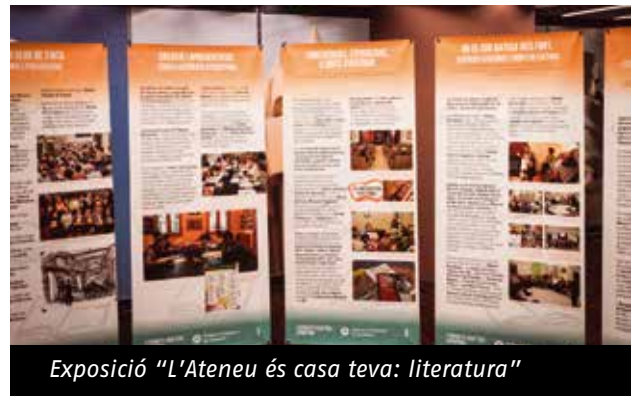
Exposició "L'Ateneu és casa teva: literatura"

Són 11 plafons que recullen el patrimoni bibliotecari, les aules de formació d'escriptura, els clubs de lectura, escriptors i escriptores, i les activitats vinculades amb la literatura i els ateneus. Aquesta exposició enceta la sèrie d'exposicions monogràfiques anuals "L'Ateneu és casa teva".