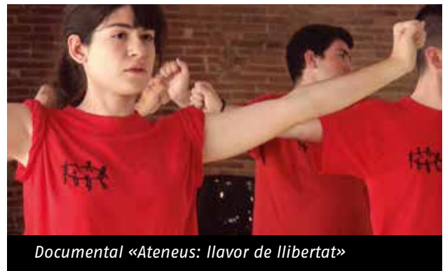
Documental «Ateneus: llavor de llibertat»

La Federació d'Ateneus, junt a la productora Nosotros treballa des del 2015 en el projecte audiovisual «Ateneus: llavor de llibertat» que està previst rodar durant el 2018. La campanya de mecenatge impulsada per la FAC ha recaptat 2.980 € d'aportacions d'entitats i particulars, dels 10.000 € que el projecte preveu per finançar part del documental. L'exercici del 2017 s'ha tancat pendent de la convocatòria de subvencions de la Corporació Catalana de Mitjans Audiovisuals per tal d'impulsar el rodatge. El documental servirà per retratar la realitat del moviment ateneístic, passant per la seva història, l'actualitat i els reptes de futur. Per tal d'obrir vies de finançament, el projecte llançarà una campanya de micromecenatge públic.