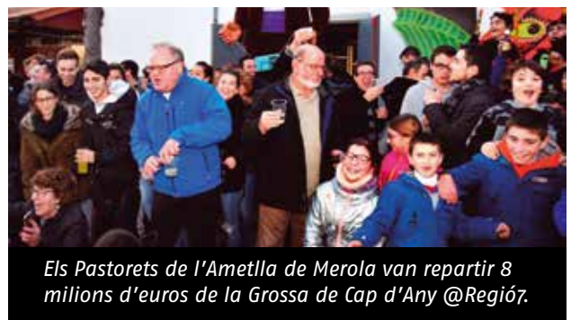
Els Pastorets de l'Ametlla de Merola van repartir 8 milions d'euros de la Grossa de Cap d'Any @Regió7.

E ls Pastorets de l'Ametlla de Merola, un nucli de menys de 200 habitants de Puig-reig (Berguedà) han repartit 8 milions d'euros del primer premi de la Grossa de Cap d'Any, el 56.795. Els responsables dels Pastorets, secció pertanyent a l'Associació Cultural l'Esplai, van vendre 80 bitllets distribuïts en 8.000 participacions del número guanyador, que van adquirir a través d'Internet, que té la seu en un restaurant de Campdorà (Girona). Cada una de les participacions jugava 40 cèntims del número guanyador, traduïts en 8.000 euros per a cada participació.