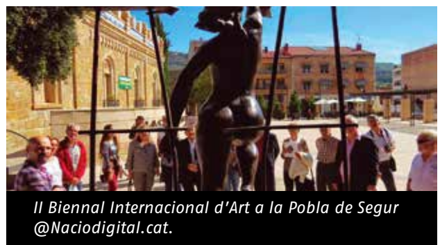
II Biennial Internacional d'Art a la Pobla de Segur.

A partir de la iniciativa de l'Associació de Cultura Comú de Particulars d'organitzar biennals d'art, iniciada als anys 50 del segle passat i represa ara fa tres anys, durant la segona quinzena d'octubre de 2017 va tenir lloc la II Biennial Internacional d'Art a la Pobla de Segur. La novetat d'aquesta edició va ser la inclusió d'artistes locals a la mostra. En total hi van participar 33 artistes de França, Itàlia i Espanya, amb un total de 76 obres exposades pels carrers i places de la vila i a les sales del Comú de Particulars. Hi va col·laborar l'Institut per a la Recerca en Escultura (ICRE).