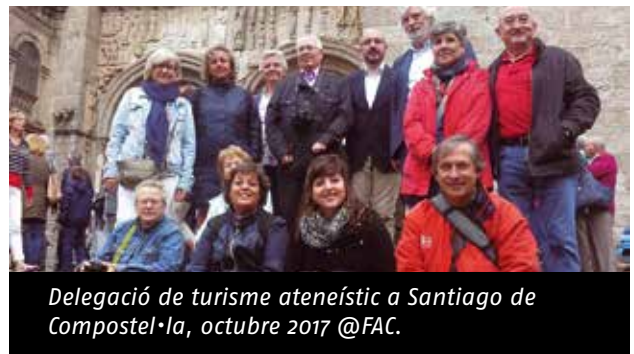
Delegació de turisme ateneístic a Santiago de Compostel·la, octubre 2017 @FAC.

Una delegació d'entitats federades ha visitat, del 12 al 14 d'octubre de 2017, ateneus gallecs per acostar relacions humanes i entre entitats d'ambdós territoris. En una nova edició del programa de "Turisme Ateneístic" impulsat per la FAC, catorze membres d'ateneus catalans han visitat patrimoni emblemàtic de les ciutats de Santiago de Compostel·la, Ourense, Lugo i Ferrol, i algunes de les seves entitats socioculturals. Ateneus d'aquestes poblacions amfitriones han acollit la delegació a les seves seus: Liceo de Ourense (Ourense) i Casino de Saviñao (Lugo), Ateneo de Santiago de Compostela (A Coruña), l'Ateneo de Ferrolán i el Casino Ferrolano (A Coruña).