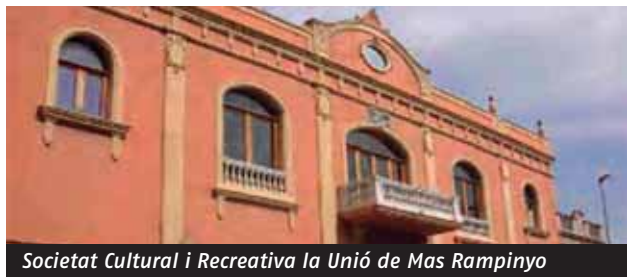
Societat Cultural i Recreativa la Unió de Mas Rampinyo

Des de la FAC seguim pensant que les visites al territori són una prioritat per conèixer de primera mà les necessitats de les entitats.