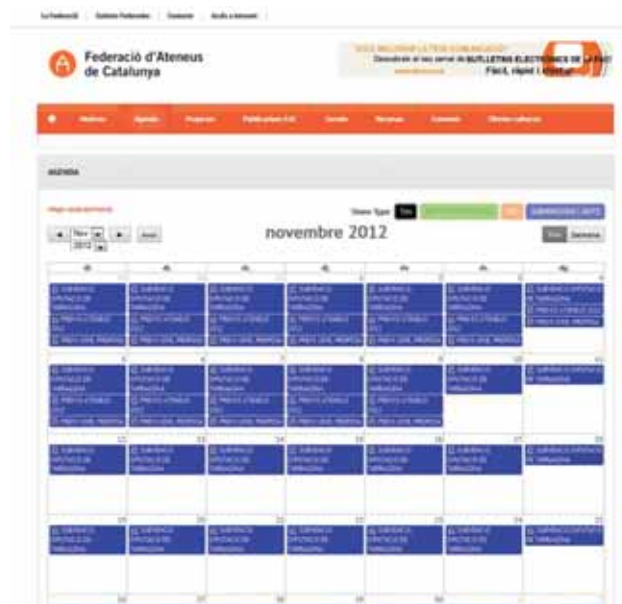
Calendari d'activitats de la federació.

Des de la FAC estem treballant perquè en breu tinguem operativa una nova agenda, on cada entitat pugui publicar-hi les seves activitats i esdeveniments. Segons els nostres càlculs, esperem que l'agenda estigui operativa a finals de setembre. Us continuarem informant i un cop estigui en marxa us farem arribar un document explicatiu perquè hi pugueu pujar els vostres esdeveniments i actualitzar-la fàcilment.