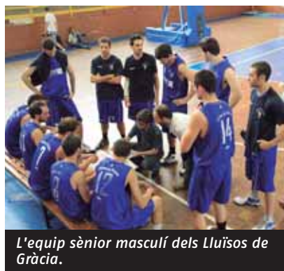
L'equip sènior masculí dels Lluïsos de Gràcia.