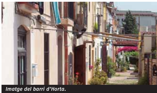
Imatge del barri d'Horta.

Si voleu participar en aquesta visita el dia 29 de setembre, només heu d'enviar un correu electrònic a ateneus@ateneus.cat abans del dia 27, però tingueu en compte que les places són limitades.