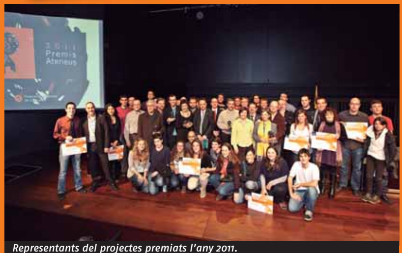
Representants del projectes premiats l'any 2011.