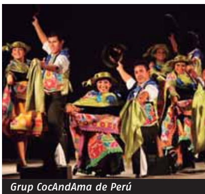
Grup CocAndAma de Perú