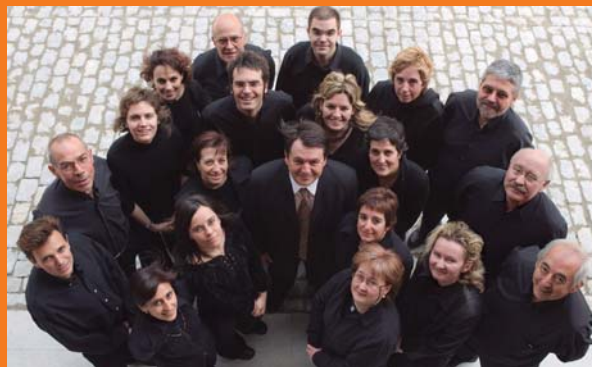
La Coral Canigó de Vic ha participat a l'Espai A

Podeu trobar el reportatge penjat al web de la Federació d'Ateneus a la secció de Recull de Premsa.