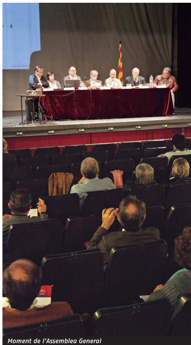
Moment de l'Assemblea General

Podeu consultar la informació de l'Assemblea i la Memòria 2011 a www.ateneus.cat .