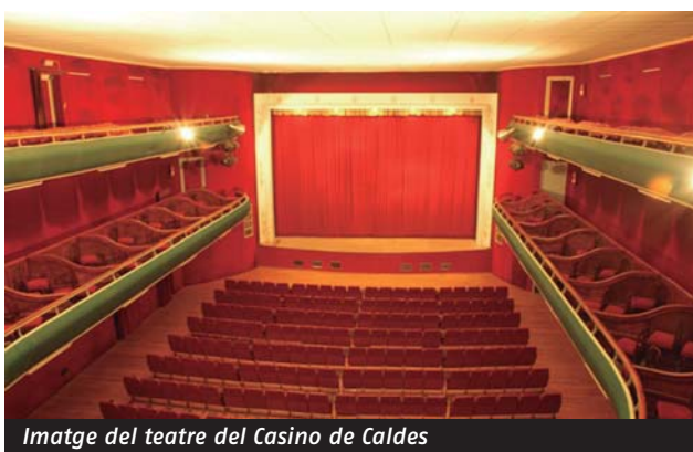
Imatge del teatre del Casino de Caldes

L es visites al territori són una prioritat per conèixer de primera mà la realitat de les entitats i les seves necessitats. Durant aquests tres mesos s'han visitat: l' Associació Cultural i Recreativa de Fals, el Centre Agrícola de Sant Sadurní d'Anoia, el Centre Cultural de Sarrià de Barcelona, l' Alzinar de Masquefa, el Reial Cercle Artístic de Barcelona, l' Ateneu Català de Sallent , l' Orfeó Martinenc de Barcelona, l' Ateneu cultural i recreatiu de Santa Margarida de Montbui, la Unió Calafina de Calaf i el Casino de Caldes de Caldes de Montbui.