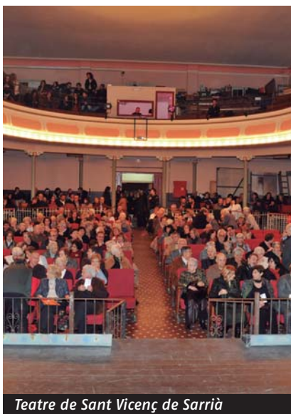
Teatre de Sant Vicenç de Sarrià