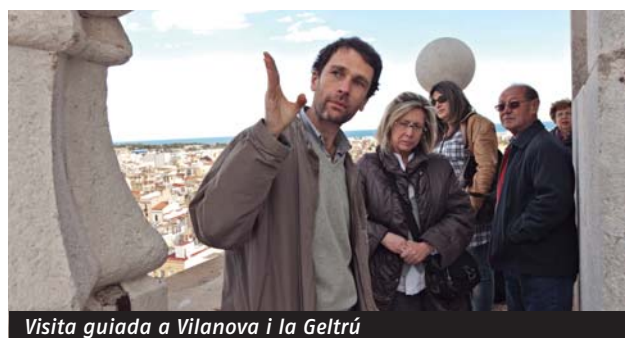
Visita guiada a Vilanova i la Geltrú

Durant el dia, els acompanyants dels directius i directives de la FAC van realitzar una visita turística per Vilanova i la Geltrú.