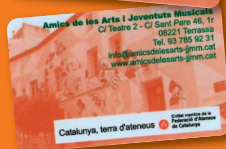
Carnet personalitzat imprès a doble cara.