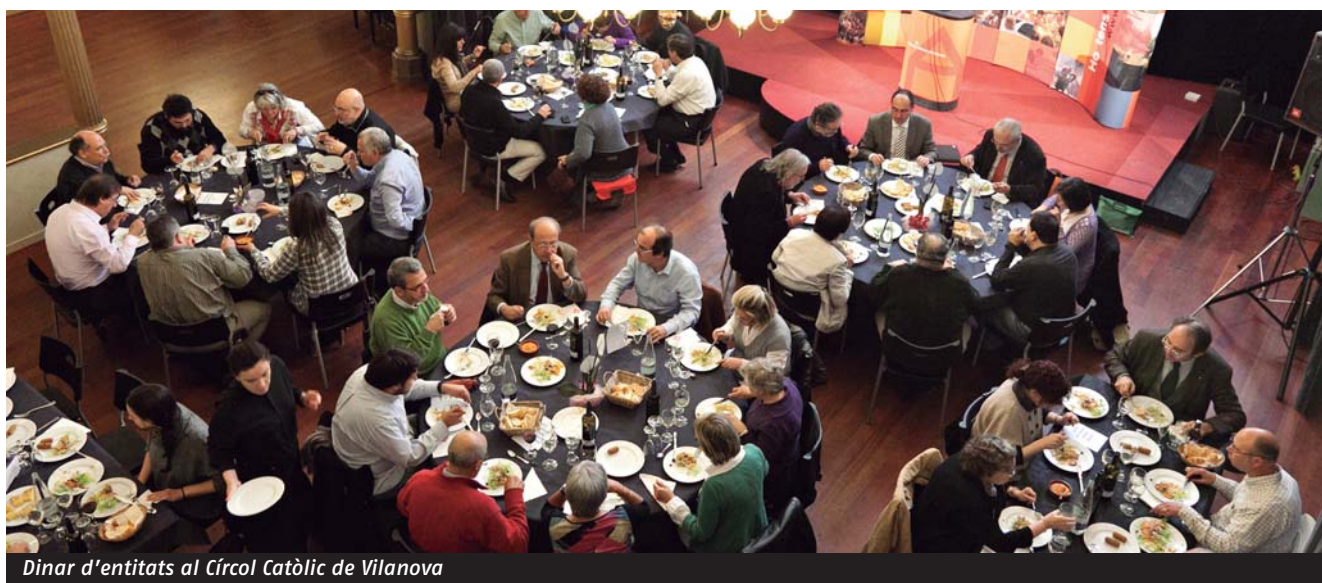
Dinar d'entitats al Círcol Catòlic de Vilanova