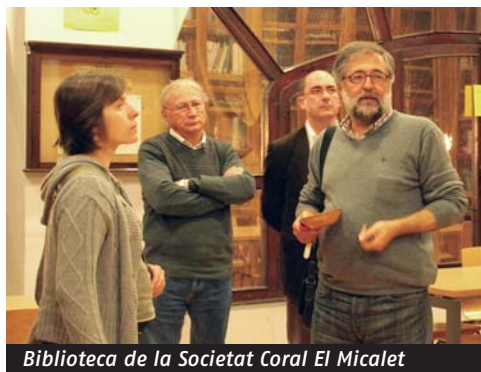
Biblioteca de la Societat Coral El Micalet

La Federació està organitzant una sortida de Turisme Ateneístic a Cadis, Màlaga i Sevilla a l'octubre. A la pàgina web www.amicsateneus.cat s'hi podrà trobar tota la informació.