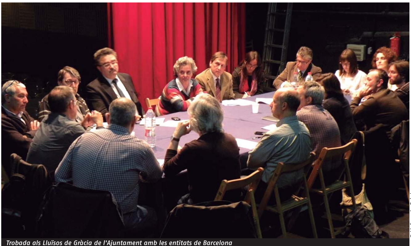
Trobada als Lluïsos de Gràcia de l'Ajuntament amb les entitats de Barcelona

Us recordem que la FAC ofereix un nou servei per elaborar un informe bàsic, realitzat per un enginyer, per saber en quina situació es troba l'entitat i les possibilitats tècniques i econòmiques per adequar-se a la normativa. Aquelles entitats que el vulgueu sol·licitar cal que us poseu en contacte directament amb la FAC a ateneus@ateneus.cat . Aquest servei té un cost econòmic molt reduït.