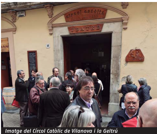
Imatge del Círcol Catòlic de Vilanova i la Geltrú