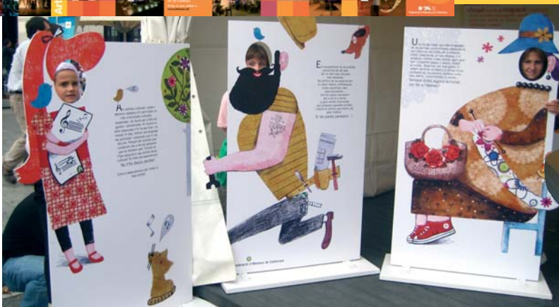
Figures gegants, on convidem a infants i adults a posar la cara