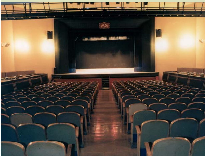
Sala nova del Centre Moral

Centre Moral i Cultural del Poblenou c. Pujades, 176-178 08005, Barcelona Tel. 93 485 36 99 secretaria@elcentrepoblenou.cat http://www.elcentrepoblenou.cat/