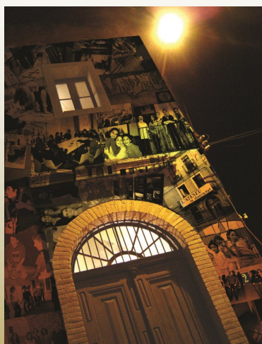
Fotografia: Ateneu Santugatenc, que el 2005 celebra el seu 50è aniversari

LA FEDERACIÓ D'ATENEUS DE CATALUNYA US DESITJA UNES BONES FESTES I UN 2006 PLE DE CULTURA, ASSOCIACIONISME I VOLUNTARIAT.