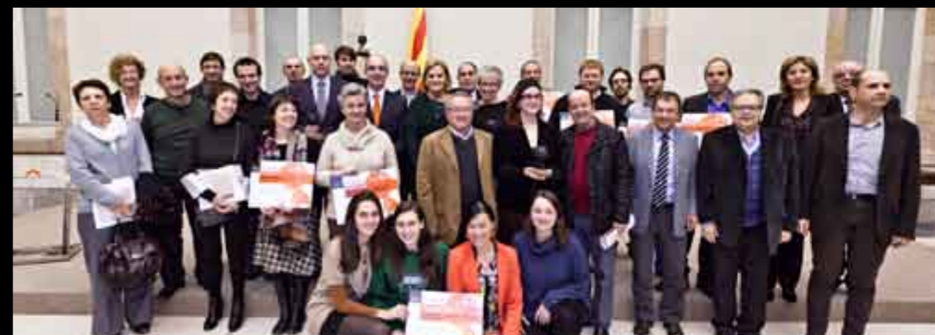
Guanyadors 2013. Autor: Toni Galitó.

Projecte «Enllaç»: impulsat per Orfeó Lleidatà amb el Centre Assistencial Sant Joan de Déu d'Almacelles, la Federació ALLEM de Lleida, la Fundació ASPROS de Lleida, l'Associació Salut Mental Ponent de Lleida, el Shalom Taller de Lleida.