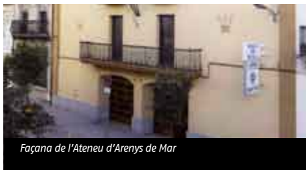
Façana de l'Ateneu d'Arenys de Mar