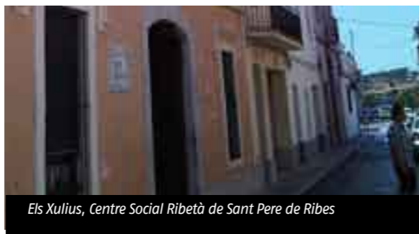
Els Xulius, Centre Social Ribetà de Sant Pere de Ribes