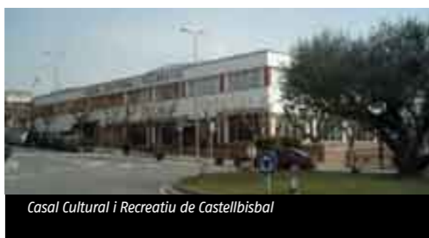
Casal Cultural i Recreatiu de Castellbisbal