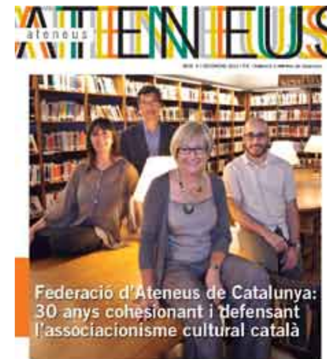
Federació d'Ateneus de Catalunya: 30 anys cohesionant i defensant l'associacionisme cultural català

E l número 9 de la revista Ateneus ha sortit publicat al mes de desembre. Coincidint amb els Premis Ateneus es van repartir alguns exemplars però cada entitat la rebrà per correu postal així com els membres del Club del Directiu i els subscriptors. La temàtica d'aquest número gira entorn a la Federació i el seu trentè aniversari amb entrevistes amb presidents, polítics, entitats i representants de la societat civil catalana. També la podreu trobar penjada en PDF al web de la FAC.