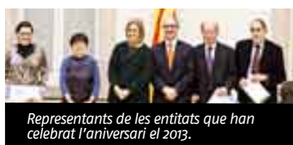
Representants de les entitats que han celebrat l'aniversari el 2013.