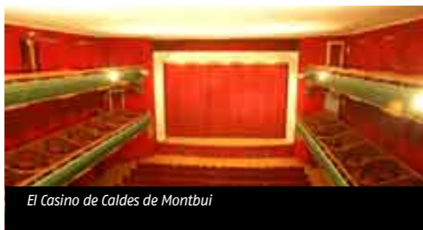
El Casino de Caldes de Montbui