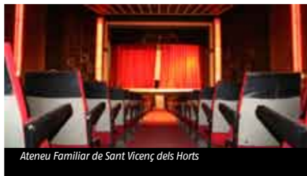
Ateneu Familiar de Sant Vicenç dels Horts

Centre Artístic del Penedès, L'Agrícola de Vilafranca del Penedès Joventut Seràfica d'Arenys de Mar Societat Casal Camprodoní de Camprodon Societat Recreativa de Riudecanyes Societat Coral Obrera «La Glòria Sentmenatca» de Sentmenat Orfeó Reusenc de Reus El Círcol de Reus La Unió Coral de Sant Feliu de Llobregat Casal d'Allella Centre Catòlic de Blanes La Concòrdia de La Vajol Societat La Fraternitat de Sant Llorenç de La Muga Associació Cultural Esplai de L'Ametlla de Merola AAV de L'Ametlla de Merola