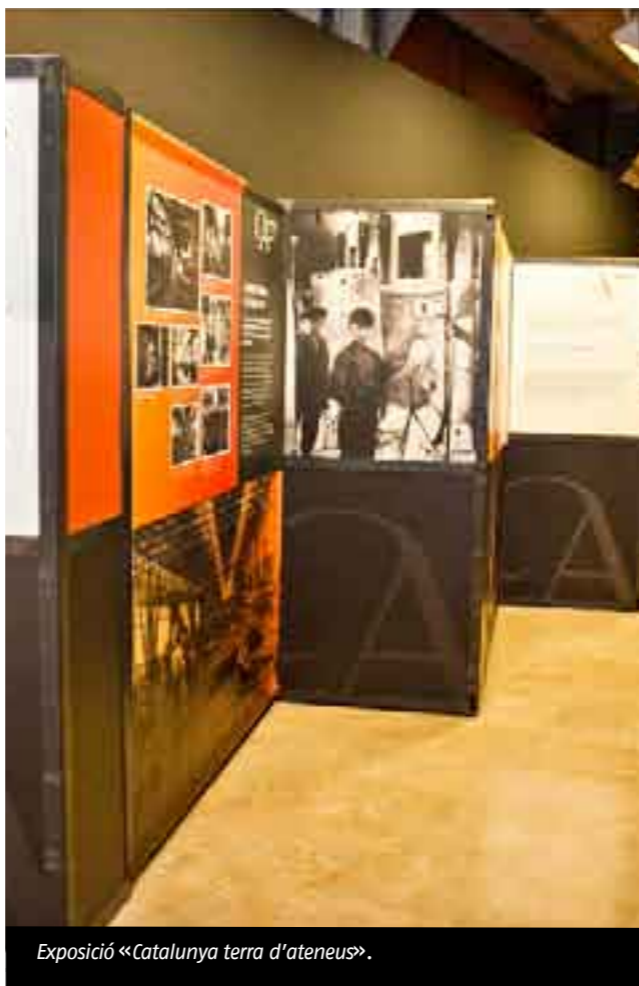
Exposició «Catalunya terra d'ateneus».

El primer any d'itinerància de l'exposició ha finalitzat a Figueres on es podrà veure fins el dia 26 de gener. Però durant el 2014 la itinerància continua, podeu sol·licitar acollir l'exposició a través del correu electrònic ateneus@ateneus.cat o trucant a la Federació al 932688130.